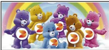
L'envers du décor.